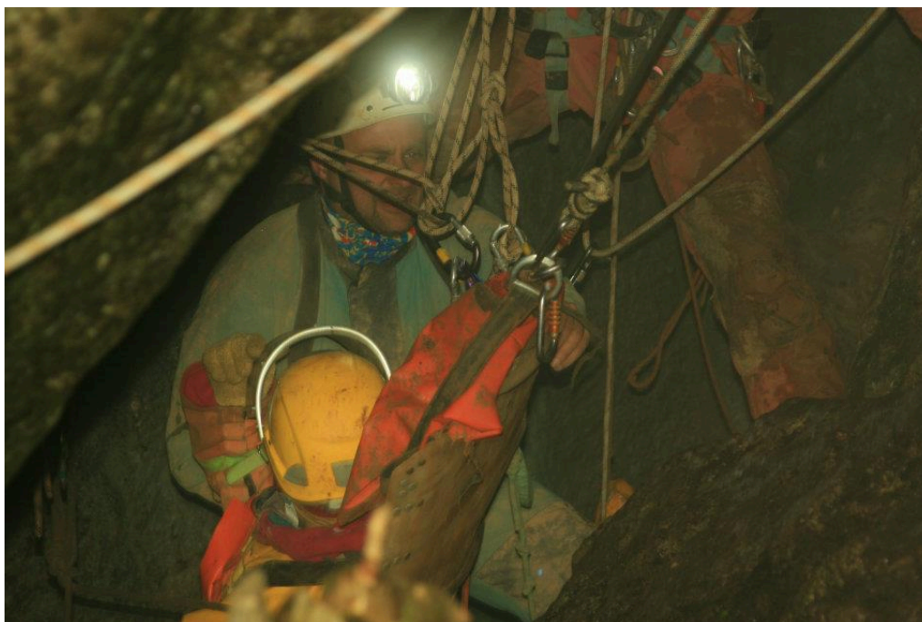
Izvlačenje nosila protuutegom.