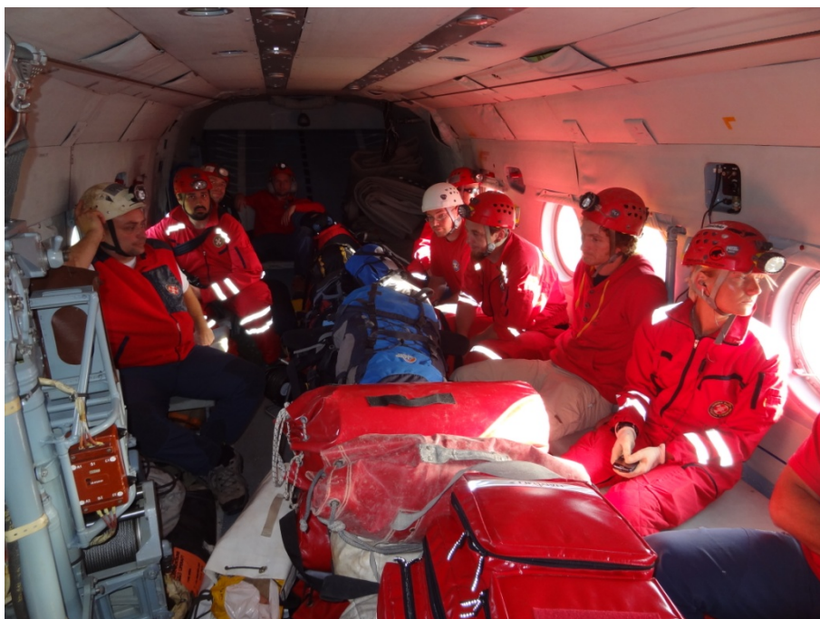
Transport spašavatelja i opreme helikopterom HRZ

U 06:00 h na aerodrom u Lučkom dolazi 11 spašavatelja iz HGSS Karlovac, Samobor i Zagreb. Nakon brifinga s pilotom i posadom helikoptera HRZ dogovoreno je da će helikopter sve spašavatelje i opremu prebaciti do Gračaca gdje će tri vozila stanice HGSS Gospić dočekati spašavatelje i opremu te ih prebaciti do ulaza jame. Helikopter polijeće u 06:20 h, a slijeće u Gračacu u 07:10 h.