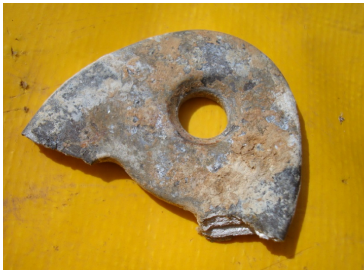
Puknuta sedlasta sidrišna pločica (dat će se na analizu).

Na putu prema mjestu planiranog bivka u Imberlanom kanalu dana 7.6.2012. godine Marijan Marović išao je predzadnji. Ispred njega već je prošlo 12 speleologa. Na zadnjoj vertikali u Nebozemlju, nešto iza 22 sata, puknula je posljednja sidrišna pločica u vertikali. Marijan se nalazio na užetu ispod te sidrišne pločice pa je s visine od 2 do 4 metra nekontrolirano završio na dnu vertikale.